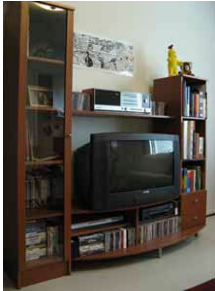
Kirjahylly löytyi huuto.net sivulta. Vuoden vanha kaluste irtosi 60 eurolla.