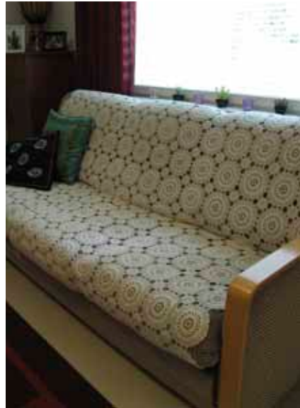
Vuodesohvan ja peitteen sain lahjoituksena sukulaisilta.