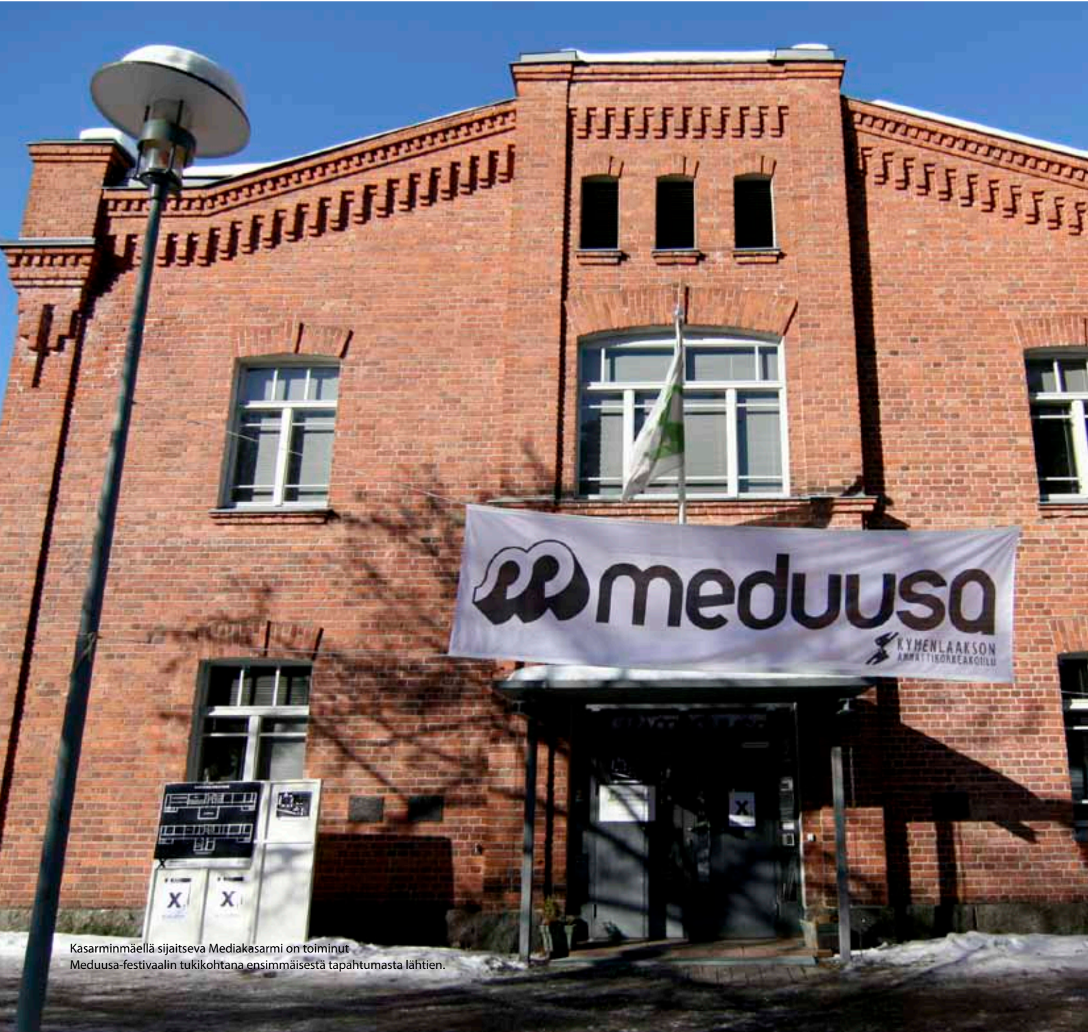
Kasarminmäellä sijaitseva Mediakasarmi on toiminut Meduusa-festivaalin tukikohtana ensimmäisestä tapahtumasta lähtien.