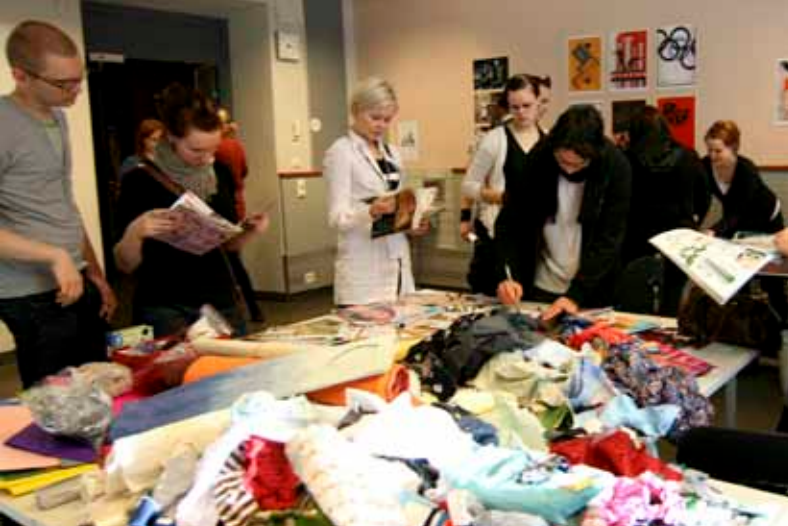
Askarteluhuone osoittautui festivaalin oheistoiminnan vetonaulaksi.