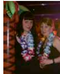
Opiskelija-aktiiviuudesta eväitä elämään.