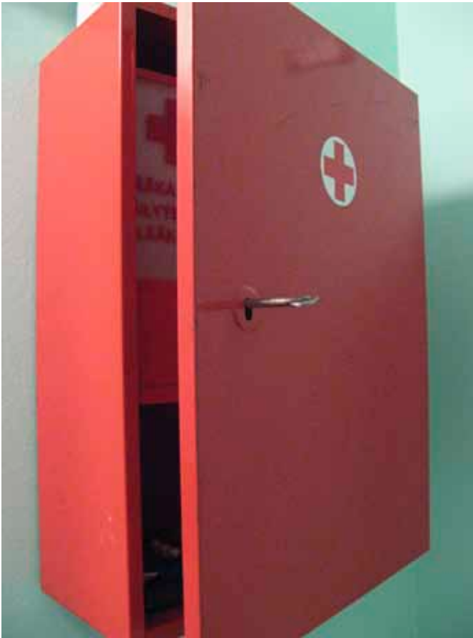
Retro-aarre löytyi kierrätyskeskuksesta. Hinta 7€.