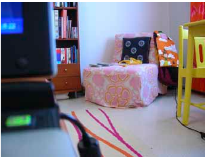
Kierrätyskeskuksesta löytynyt nojatuoli levitettävissä vuoteeksi, hinta 7€.