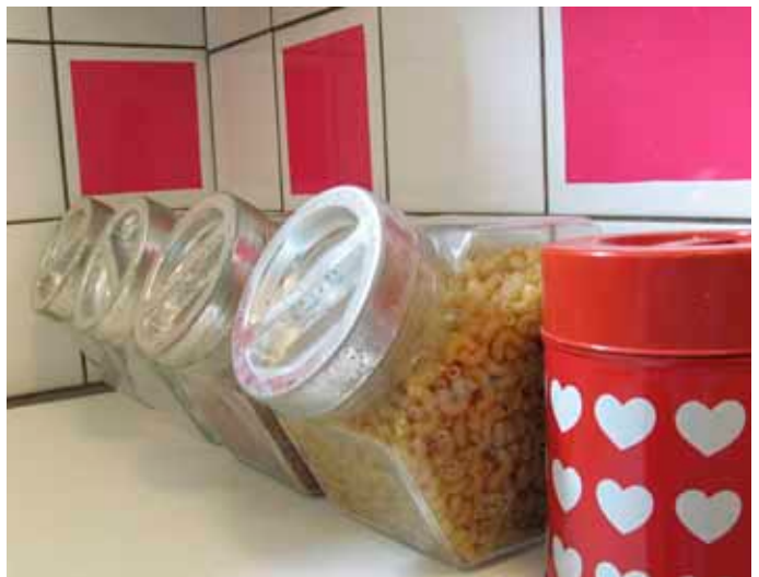
Väriä asunnon kaakelipinnoille saa kontaktimuovein. Idea on sovelluskelpoinen ja ilme helppo sekä nopea vaihtaa. Säilytyspurmukat kirpputorilta, hinta yhteensä 2 €.