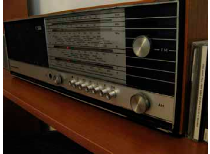
Radio on isän vanha, suoraan 70-luvulta. Toimintakuntoinen, pienet sivuäänät kuuluvat asiaan.