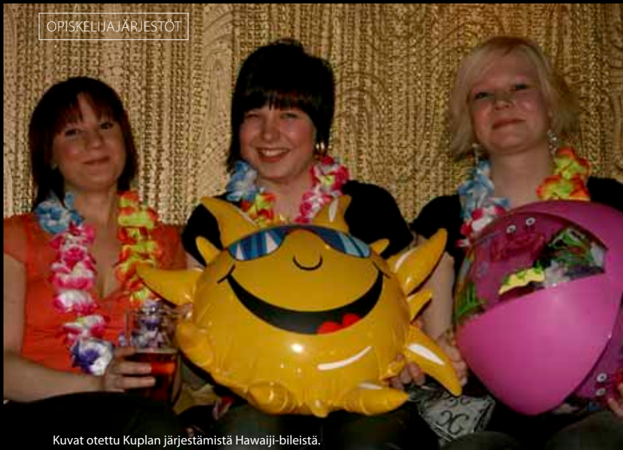
Kuvat otettu Kuplan järjestämästä Hawaiji-bileistä.